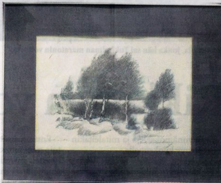
Savitaipaleen osuuspankin kokoelmista löytyy Auli Wahlbergin maisemapiirros.

– Luonnollisesti näyttelyssä on esillä myös useita